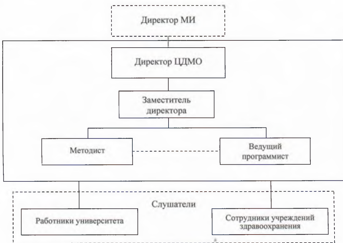
Рисунок 1—Организационно-управленческая структура Центра дополнительного медицинского образования

2.3. Решения об изменении структуры Центра, ликвидации Центра принимаются Ученым советом университета по представлению Ученого совета медицинского института на основании решения служебного совещания ЦДО и утверждаются приказом ректора.