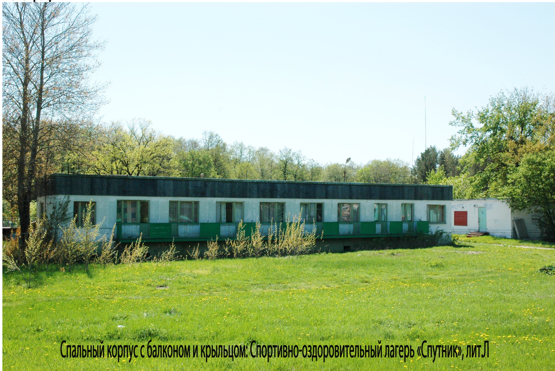
Спальный корпус с балконом и крыльцом: Спортивно-оздоровительный лагерь «Спутник», лит.Л