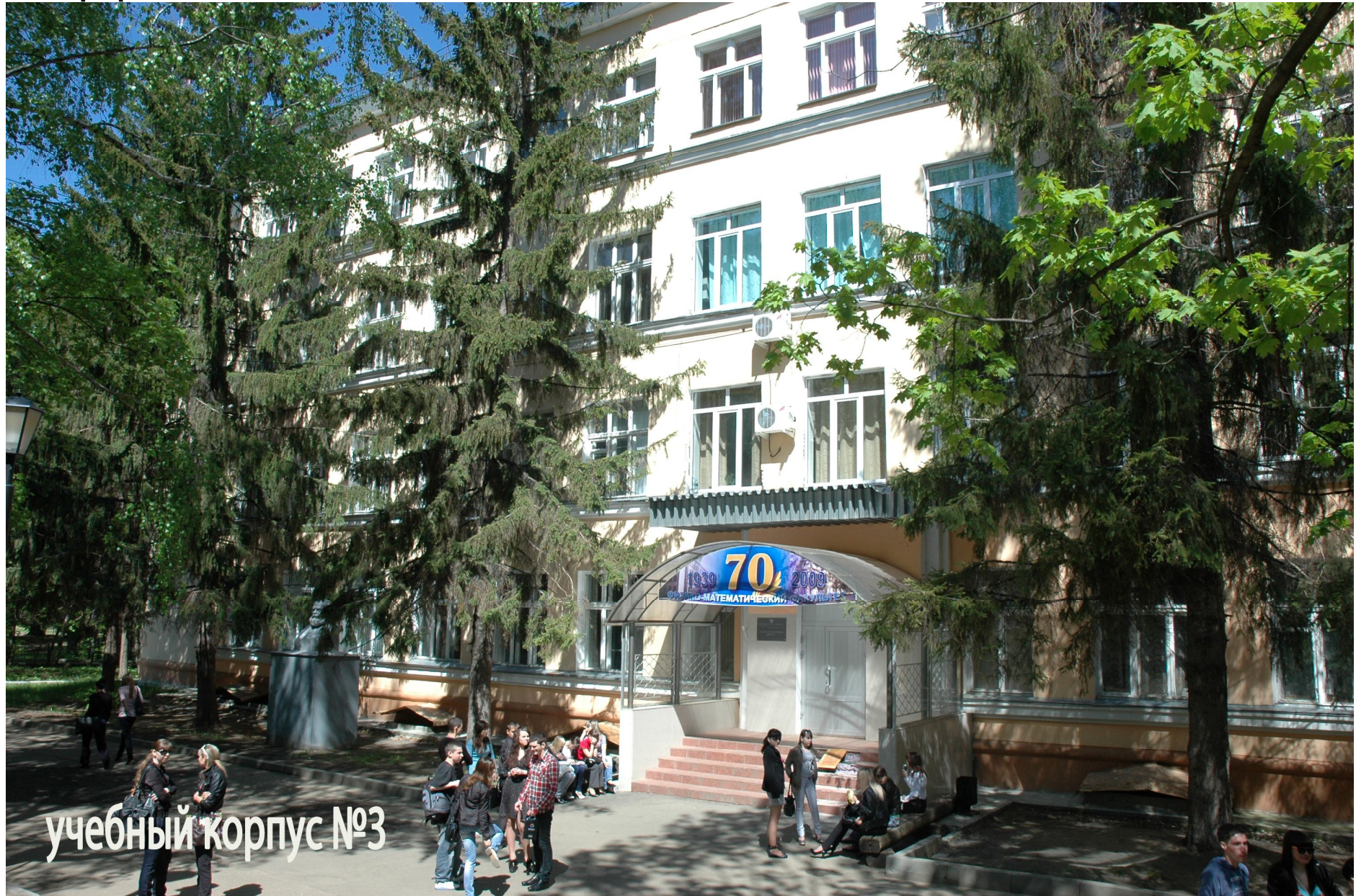
учебный корпус №3