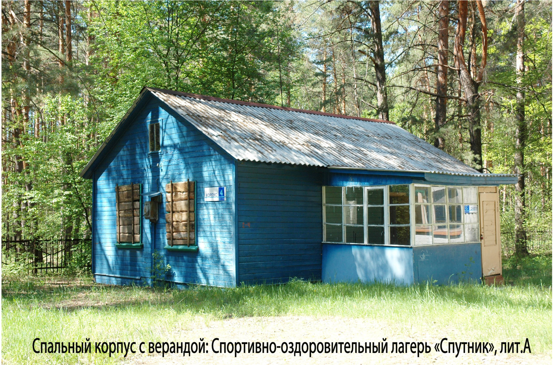
Спальный корпус с верандой: Спортивно-оздоровительный лагерь «Спутник», лит.А