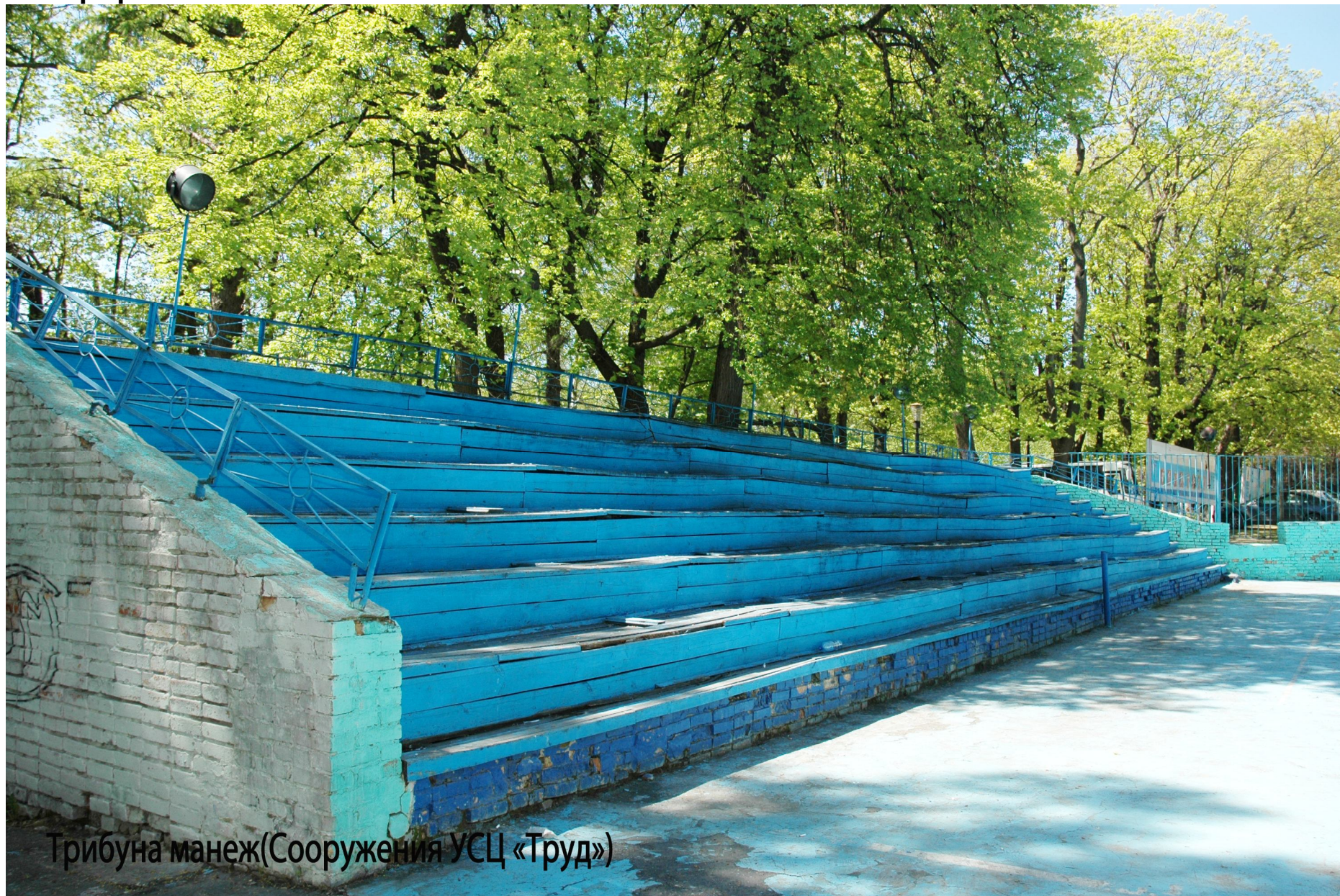
Трибуна манеж(Сооружения УСЦ «Труд»)