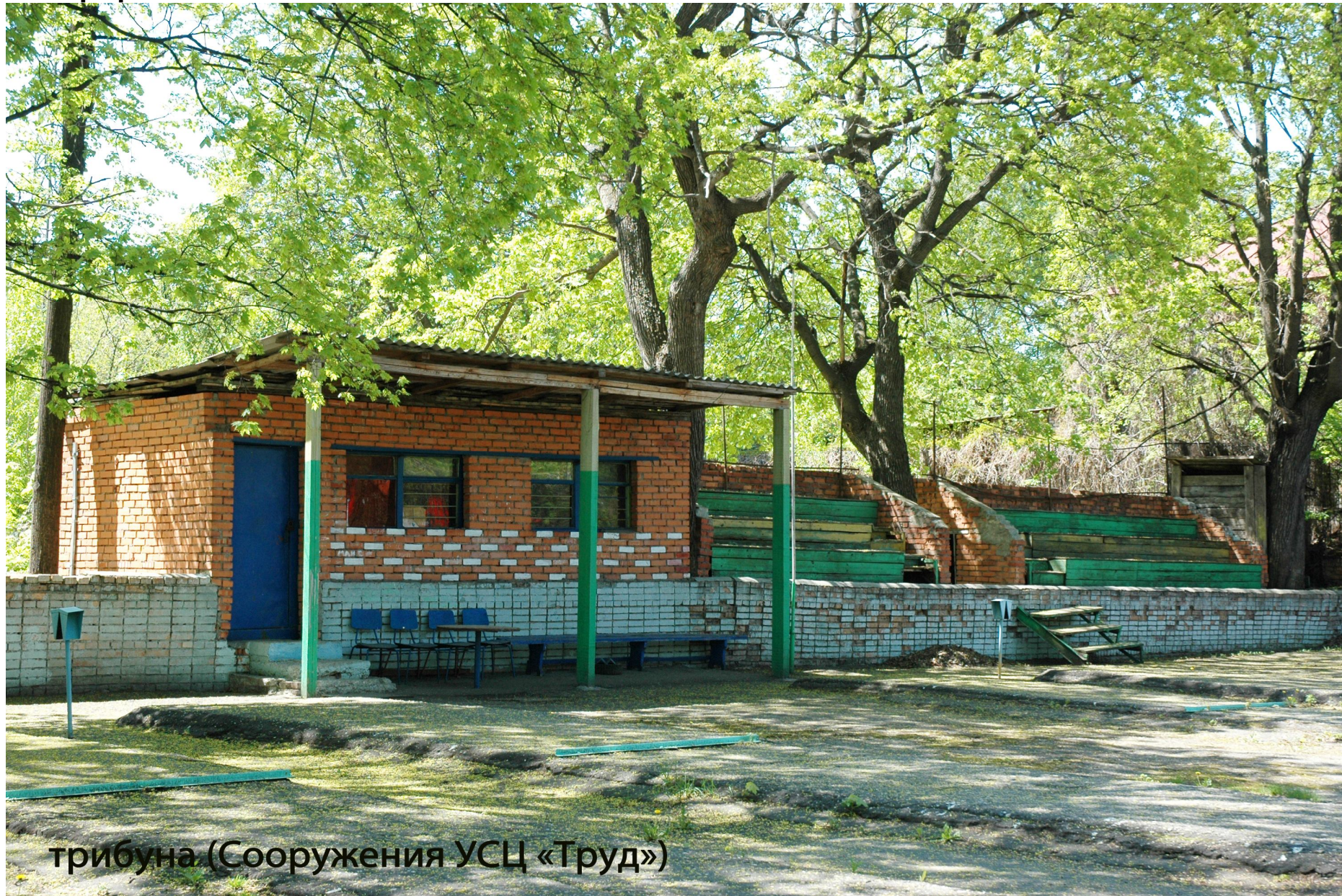
трибуна (Сооружения УСЦ «Труд»)