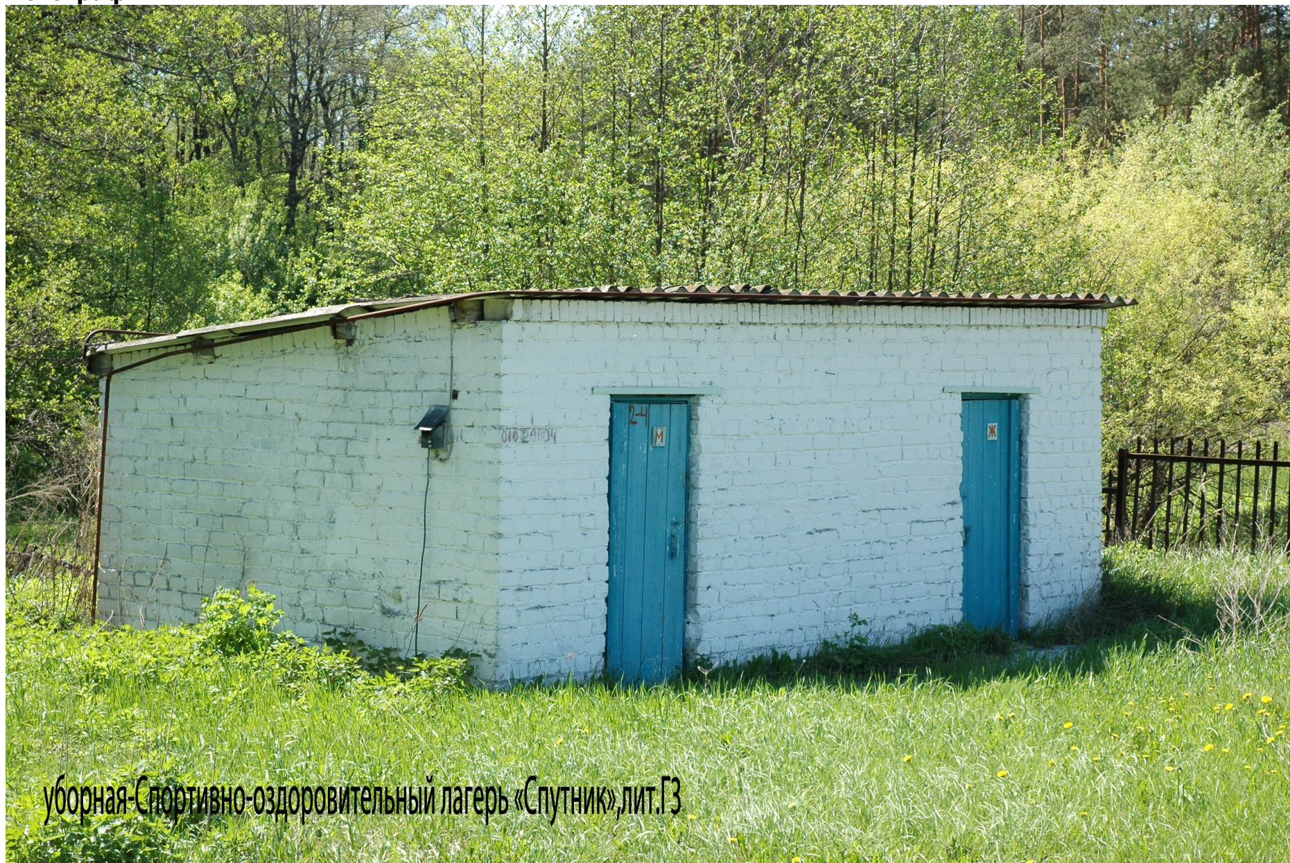
уборная-Спортивно-оздоровительный лагерь «Спутник», лит.ГЗ