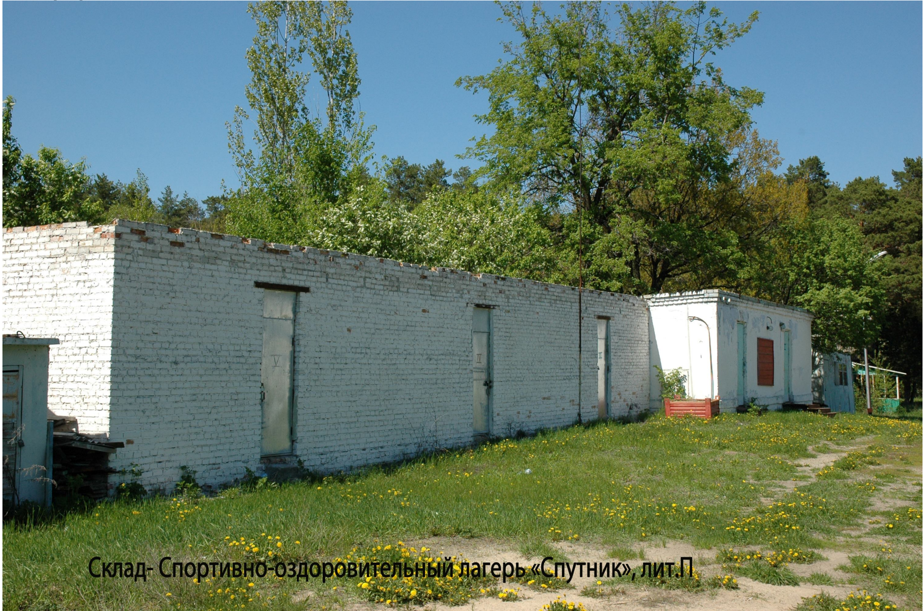
Склад- Спортивно-оздоровительный лагерь «Спутник», лит.П