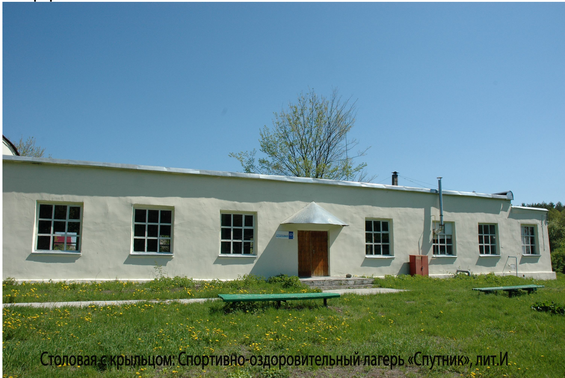
Столовая с крыльцом: Спортивно-оздоровительный лагерь «Спутник», лит.И