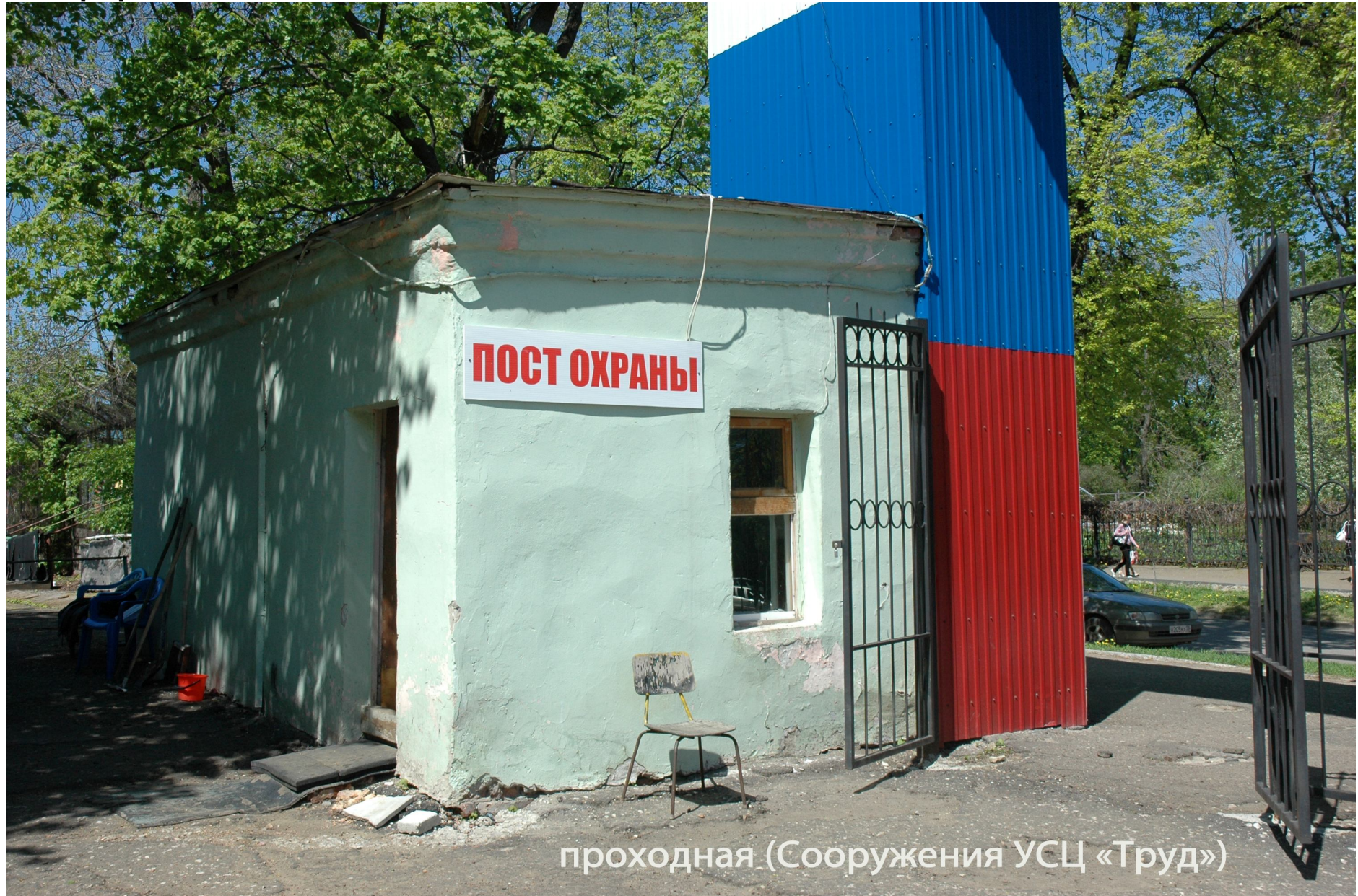
проходная (Сооружения УСЦ «Труд»)