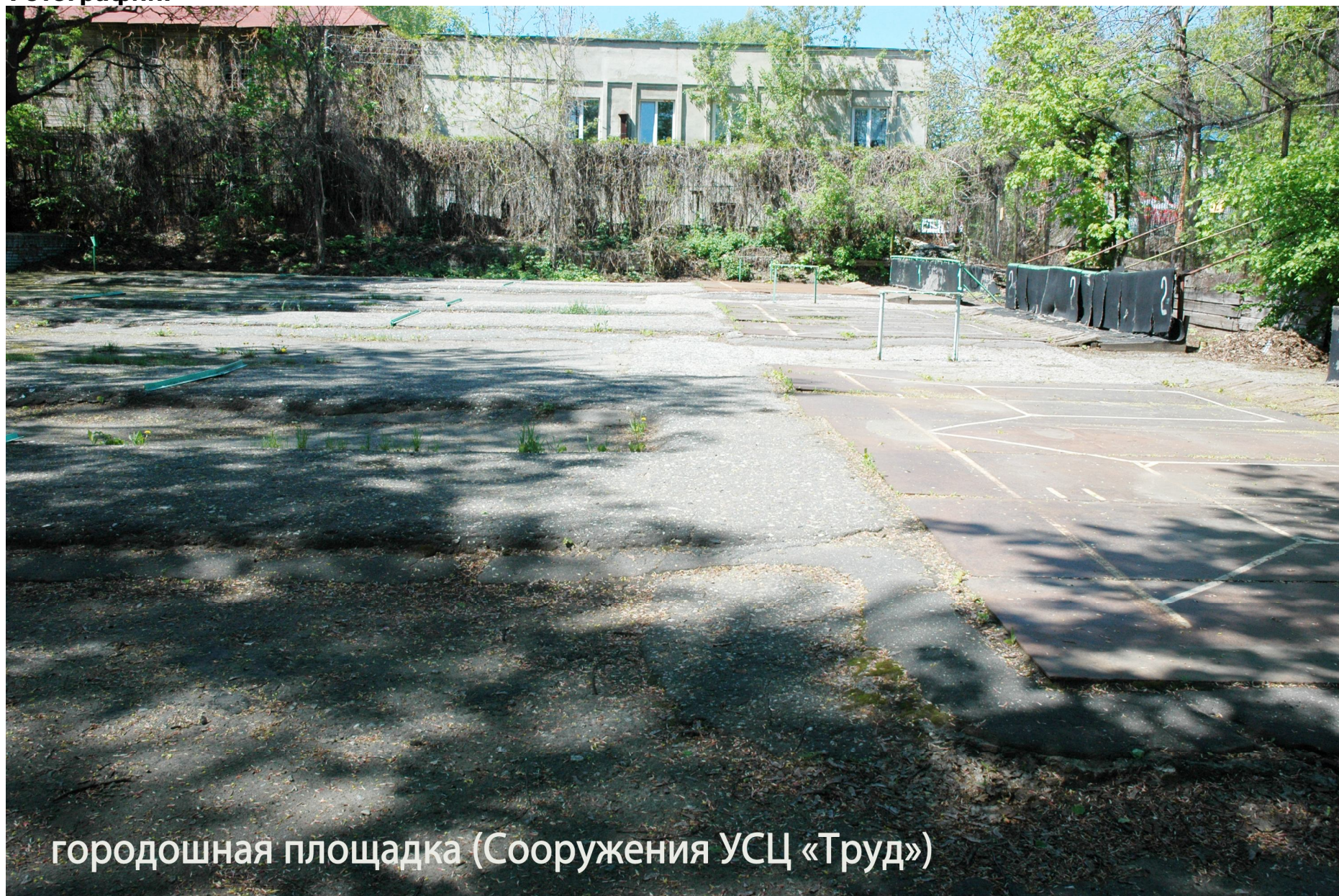
городошная площадка (Сооружения УСЦ «Труд»)