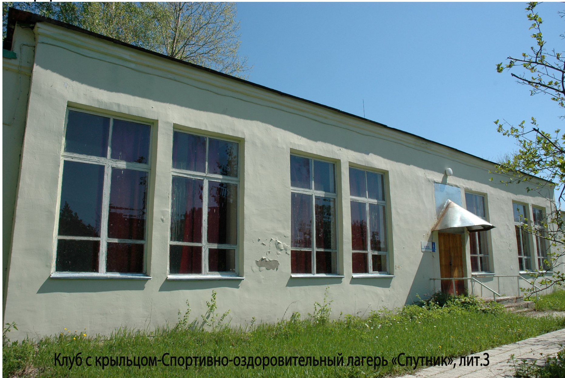
Клуб с крыльцом-Спортивно-оздоровительный лагерь «Спутник», лит.3