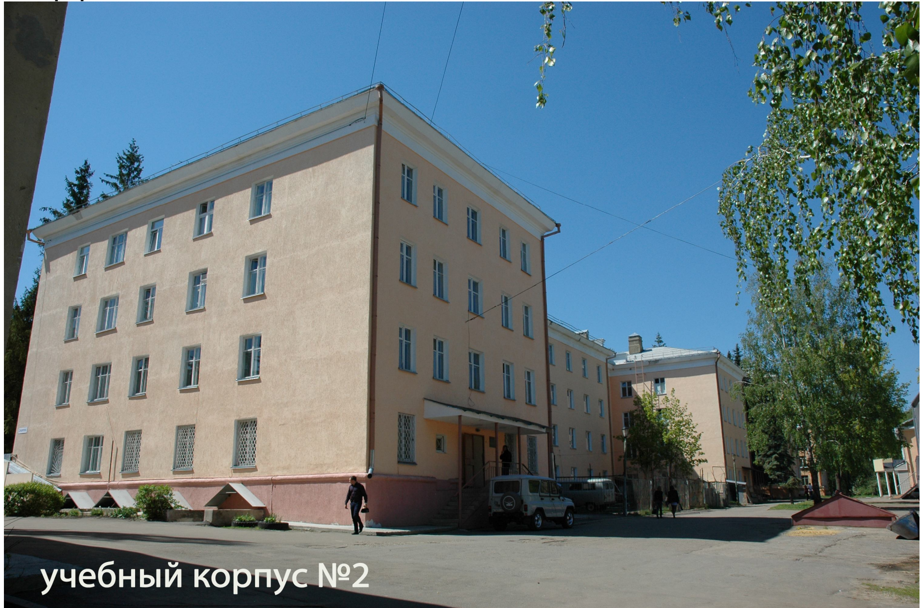
учебный корпус №2