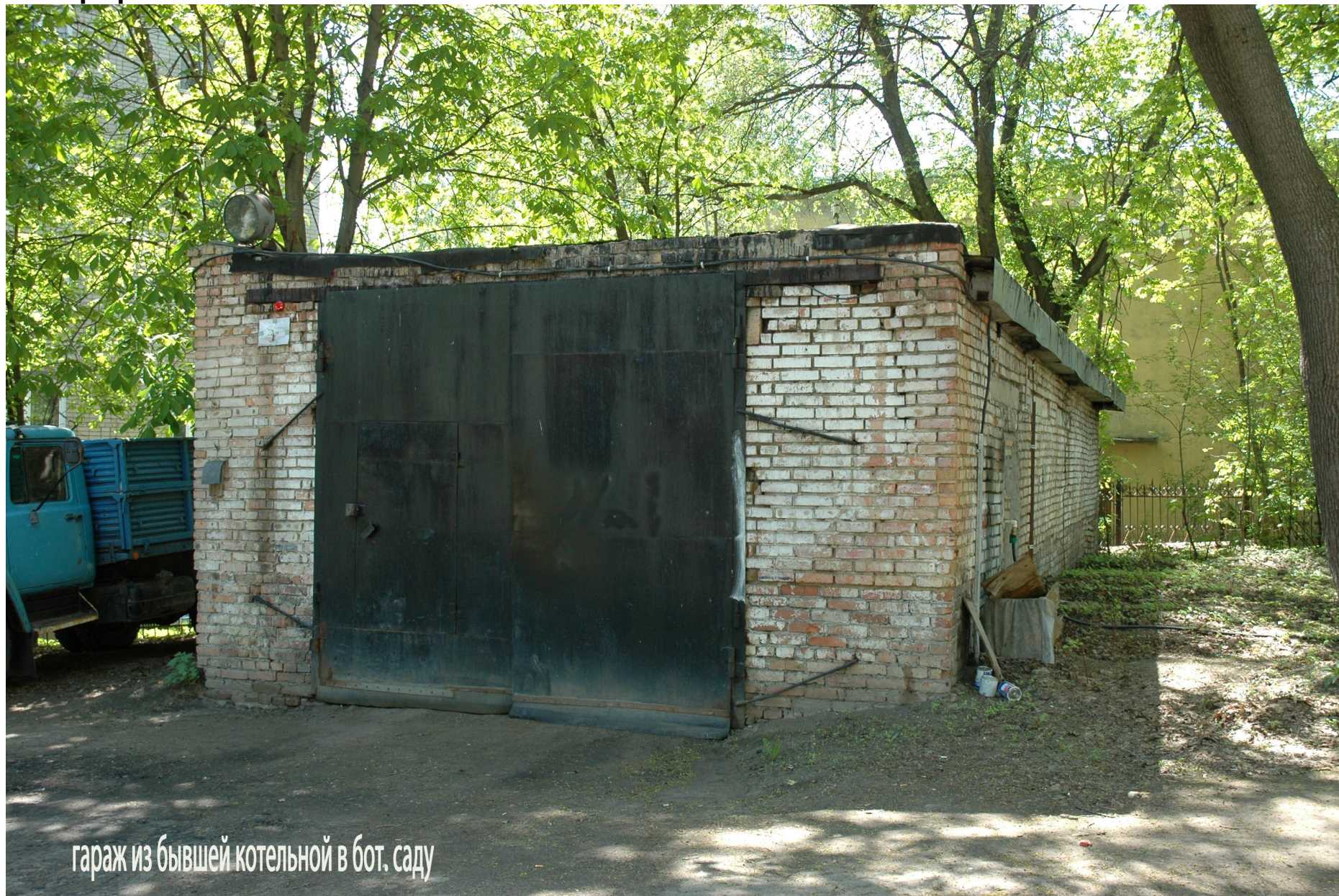
гараж из бывшей котельной в бот. саду