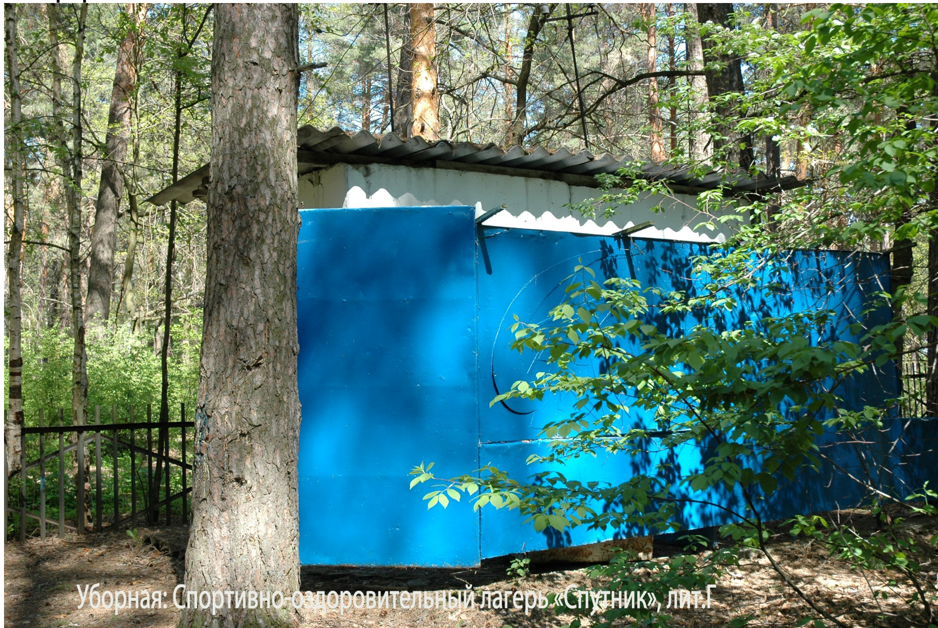
Уборная: Спортивно-оздоровительный лагерь «Спутник», лит.Г