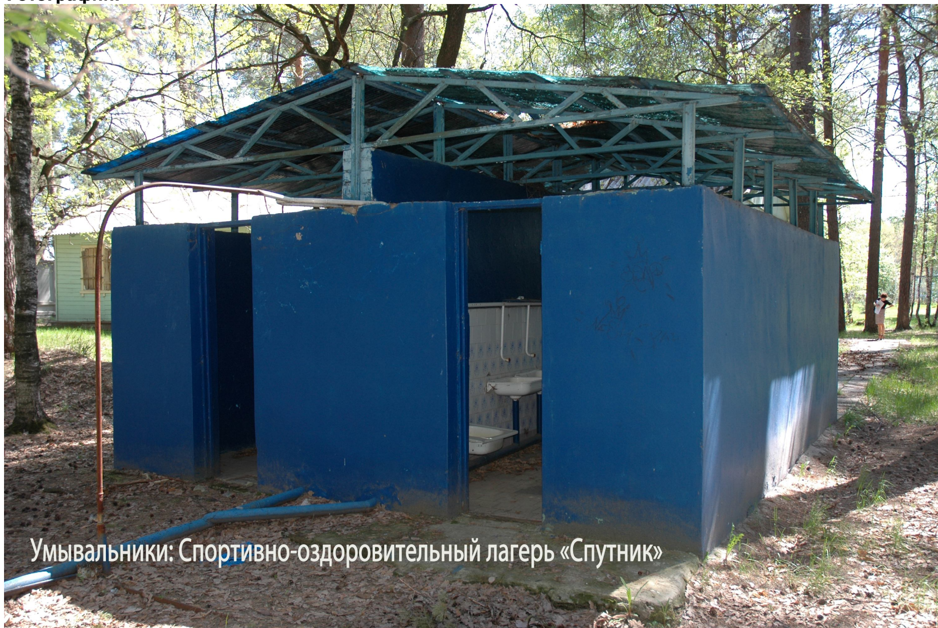
Умывальники: Спортивно-оздоровительный лагерь «Спутник»