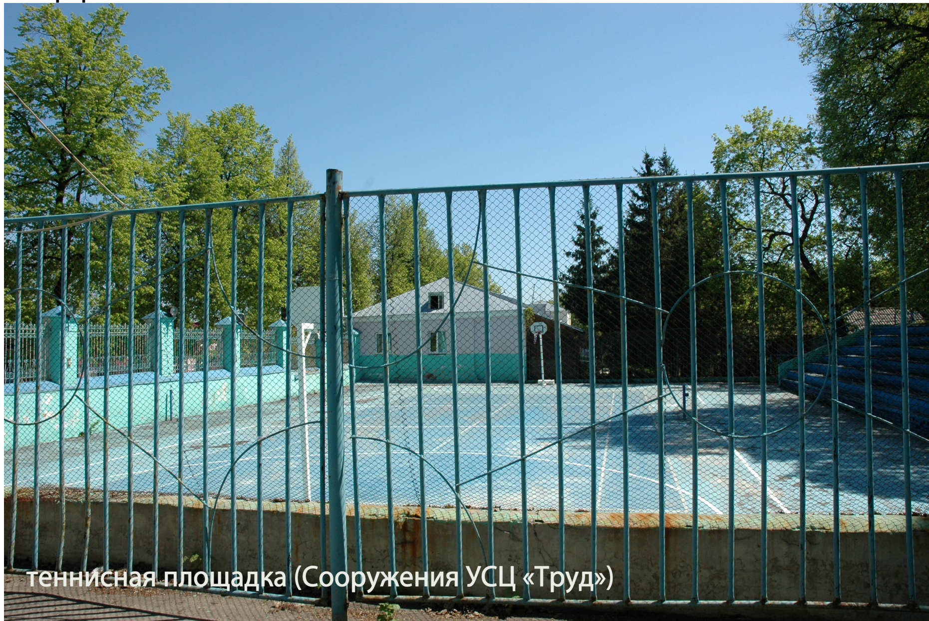
теннисная площадка (Сооружения УСЦ «Труд»)