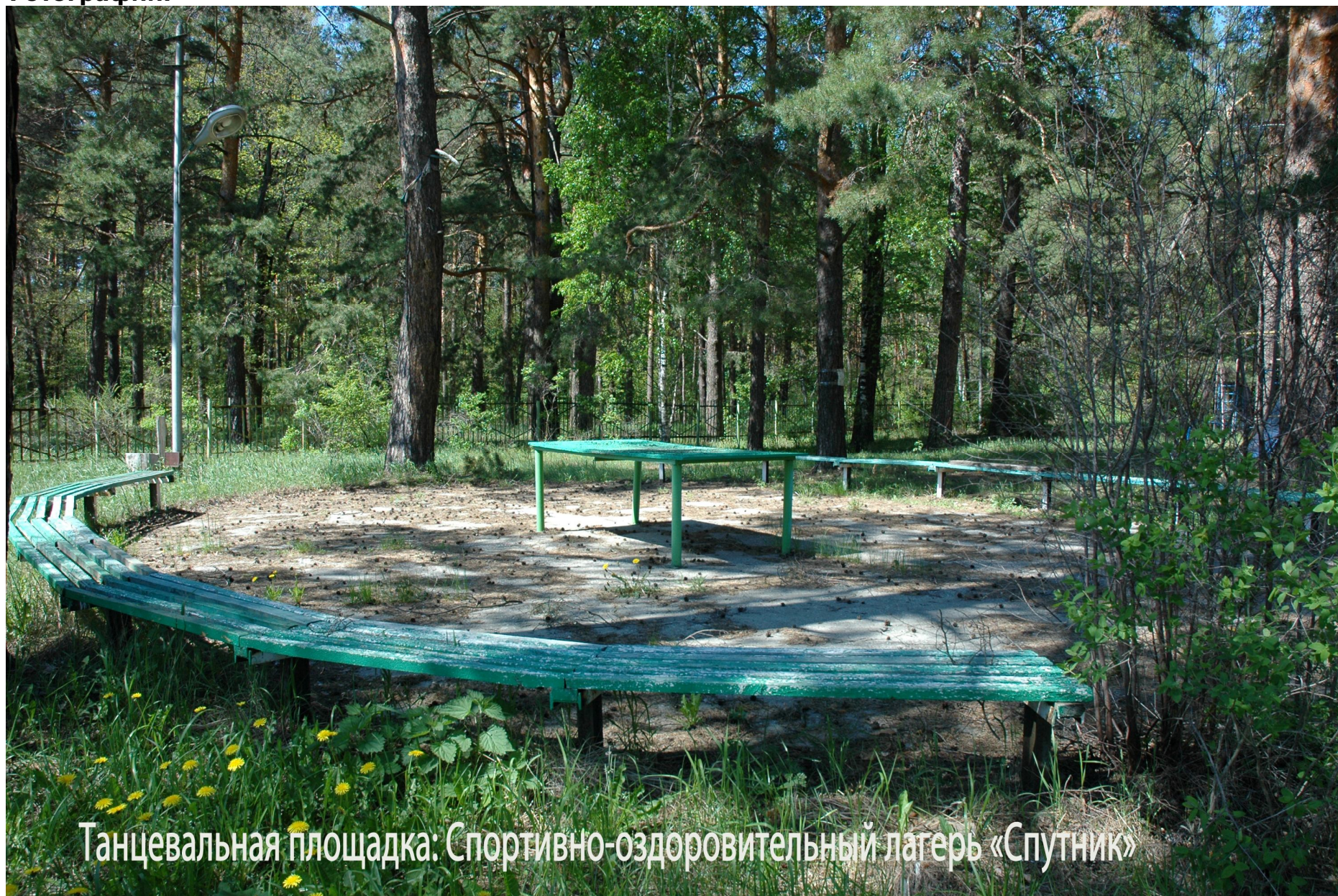
Танцевальная площадка: Спортивно-оздоровительный лагерь «Спутник»