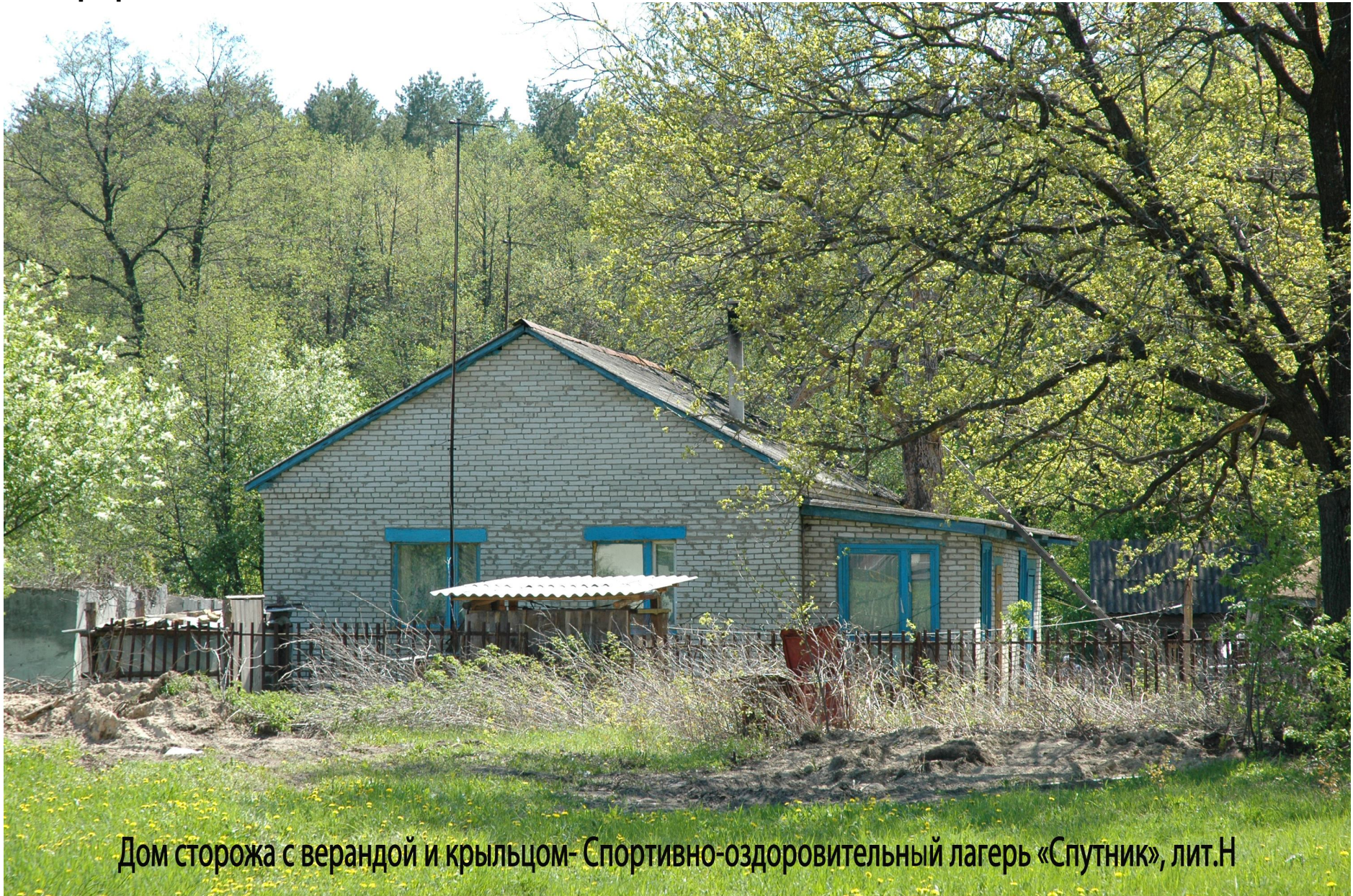
Дом сторожа с верандой и крыльцом- Спортивно-оздоровительный лагерь «Спутник», лит.Н