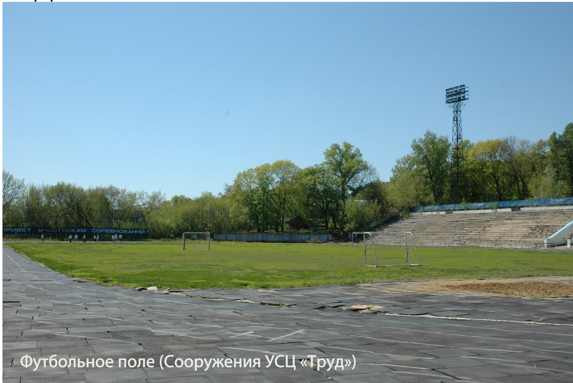
Футбольное поле (Сооружения УСЦ «Труд»)