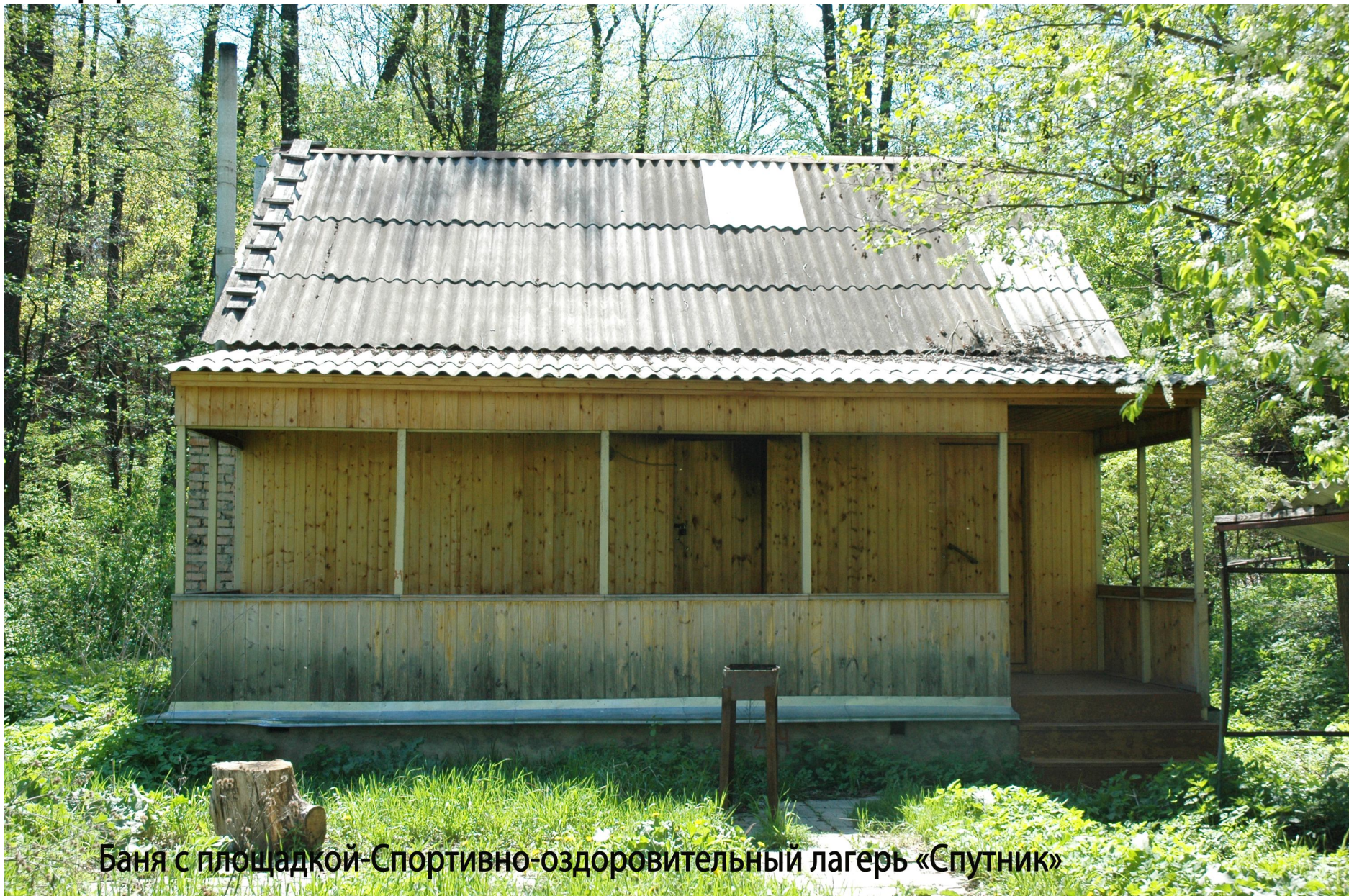
Баня с площадкой-Спортивно-оздоровительный лагерь «Спутник»