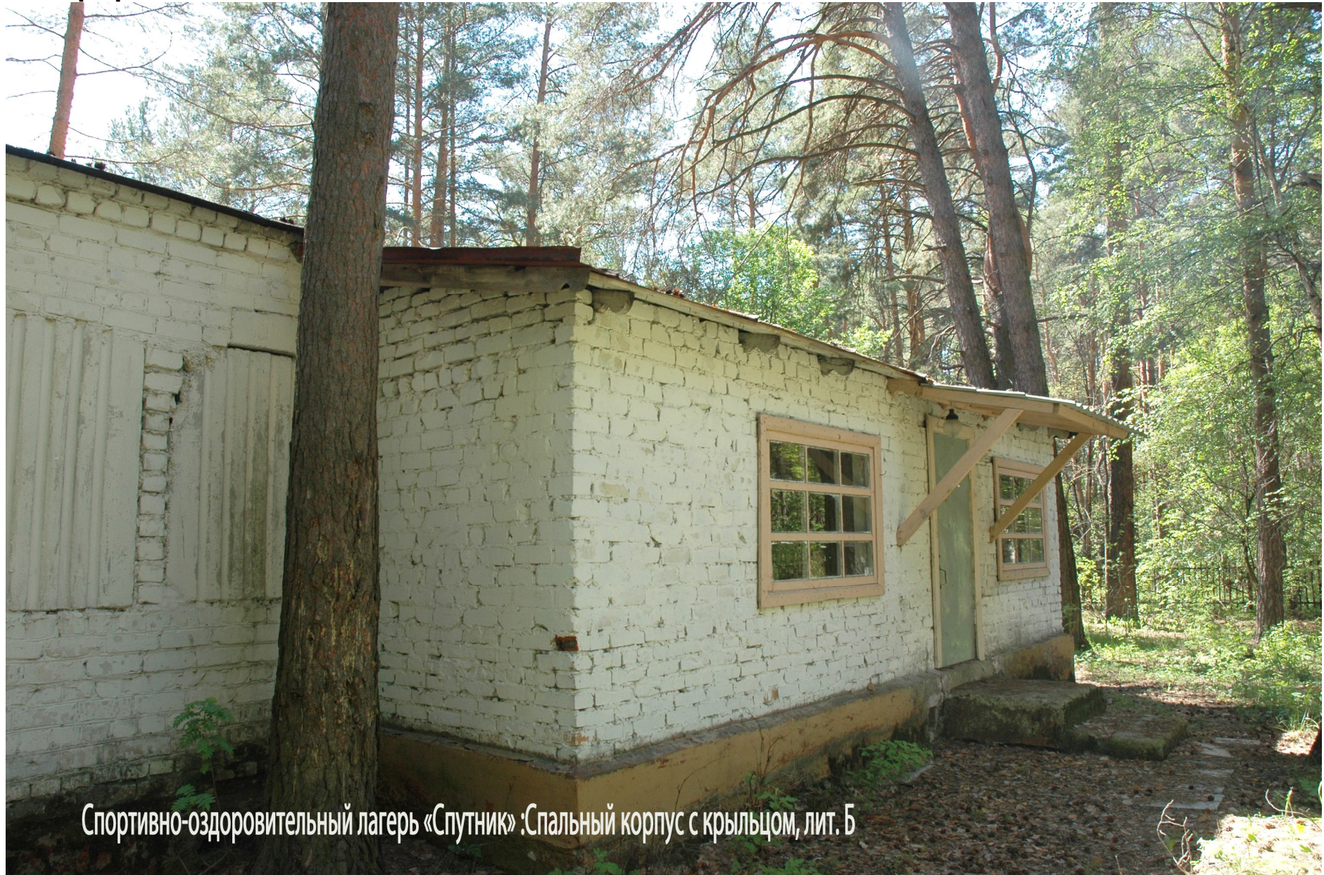
Спортивно-оздоровительный лагерь «Спутник»: Спальный корпус с крыльцом, лит. Б