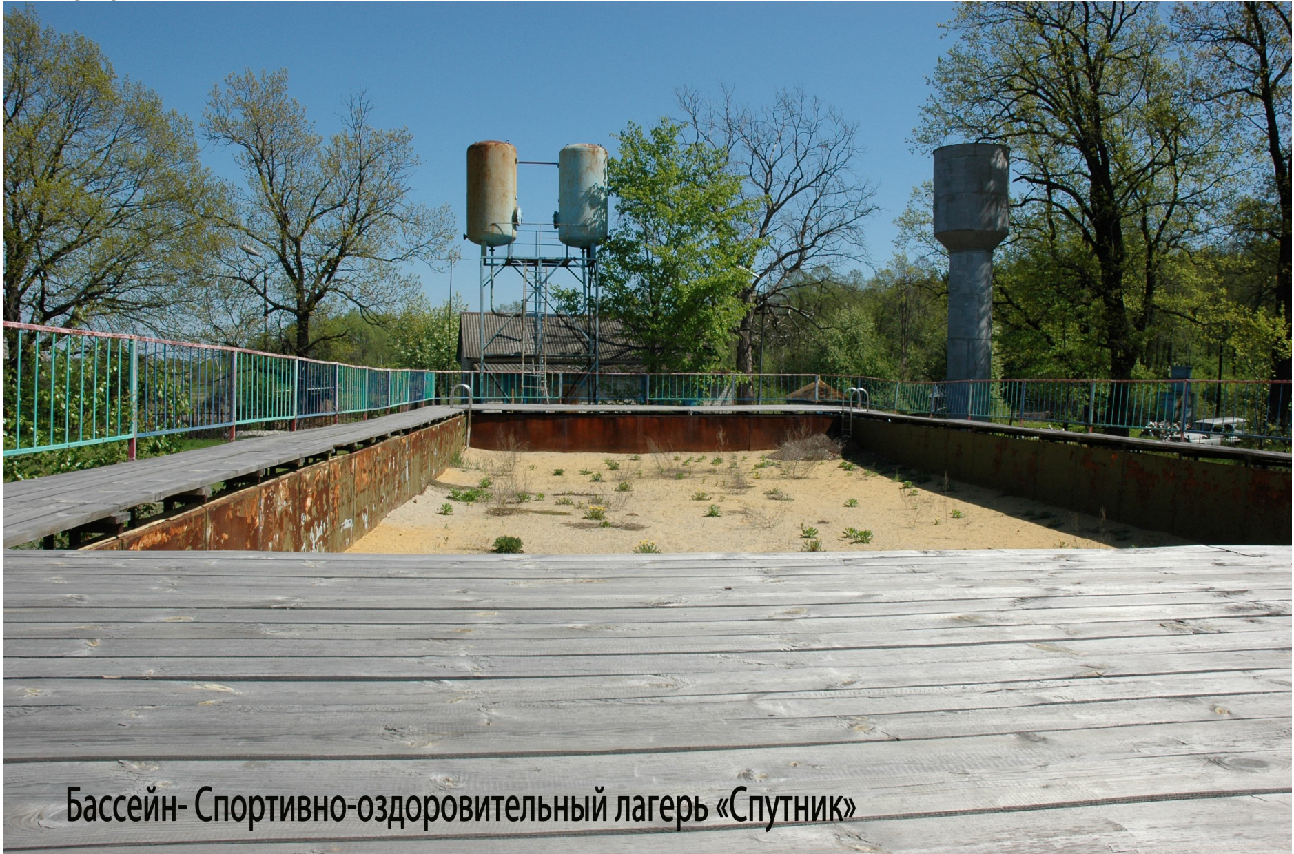
Бассейн- Спортивно-оздоровительный лагерь «Спутник»