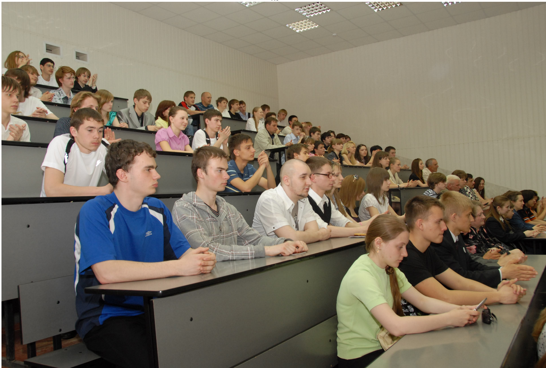
Год постройки: 1987