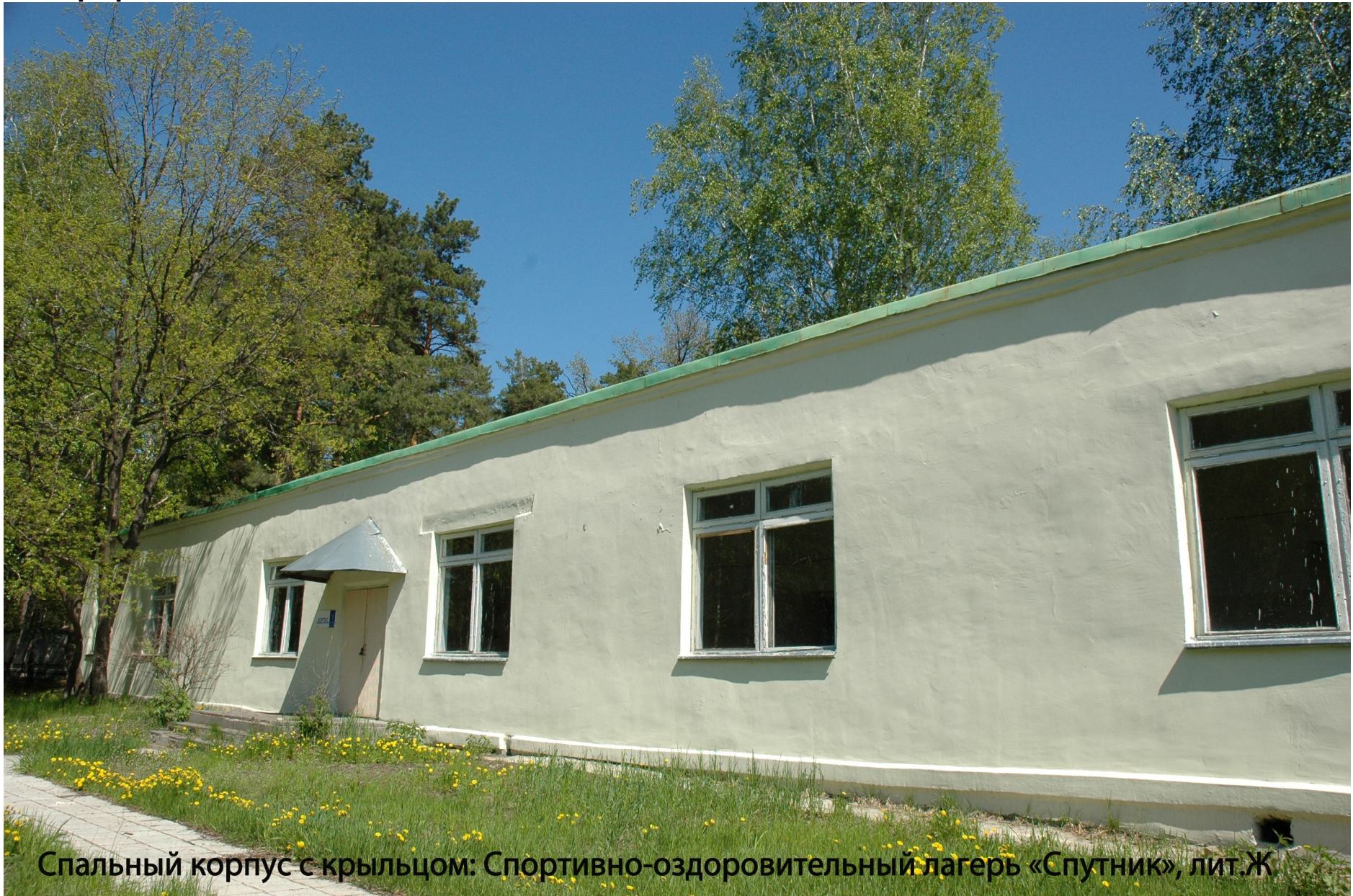
Спальный корпус с крыльцом: Спортивно-оздоровительный лагерь «Спутник», лит.Ж