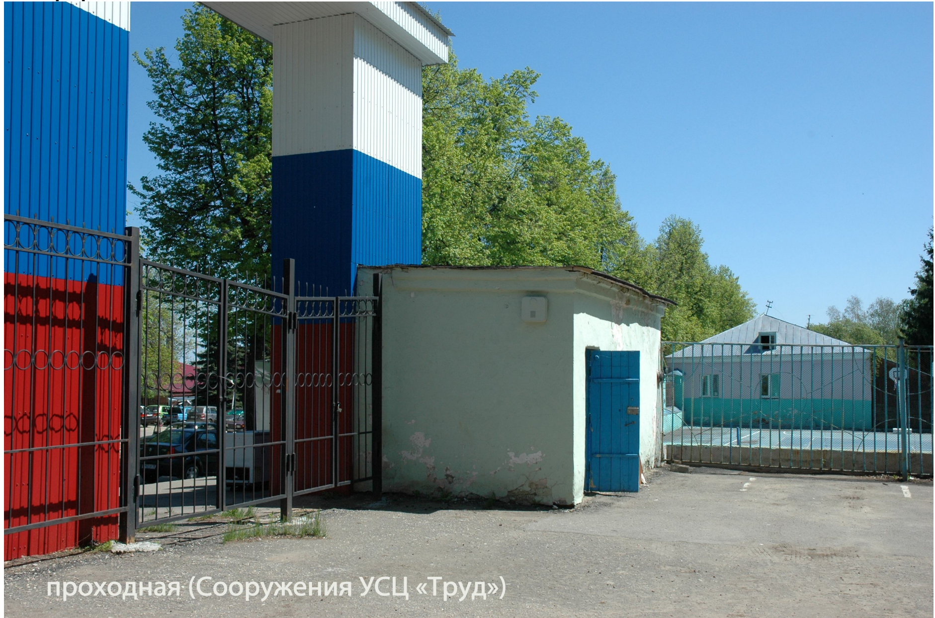
проходная (Сооружения УСЦ «Труд»)