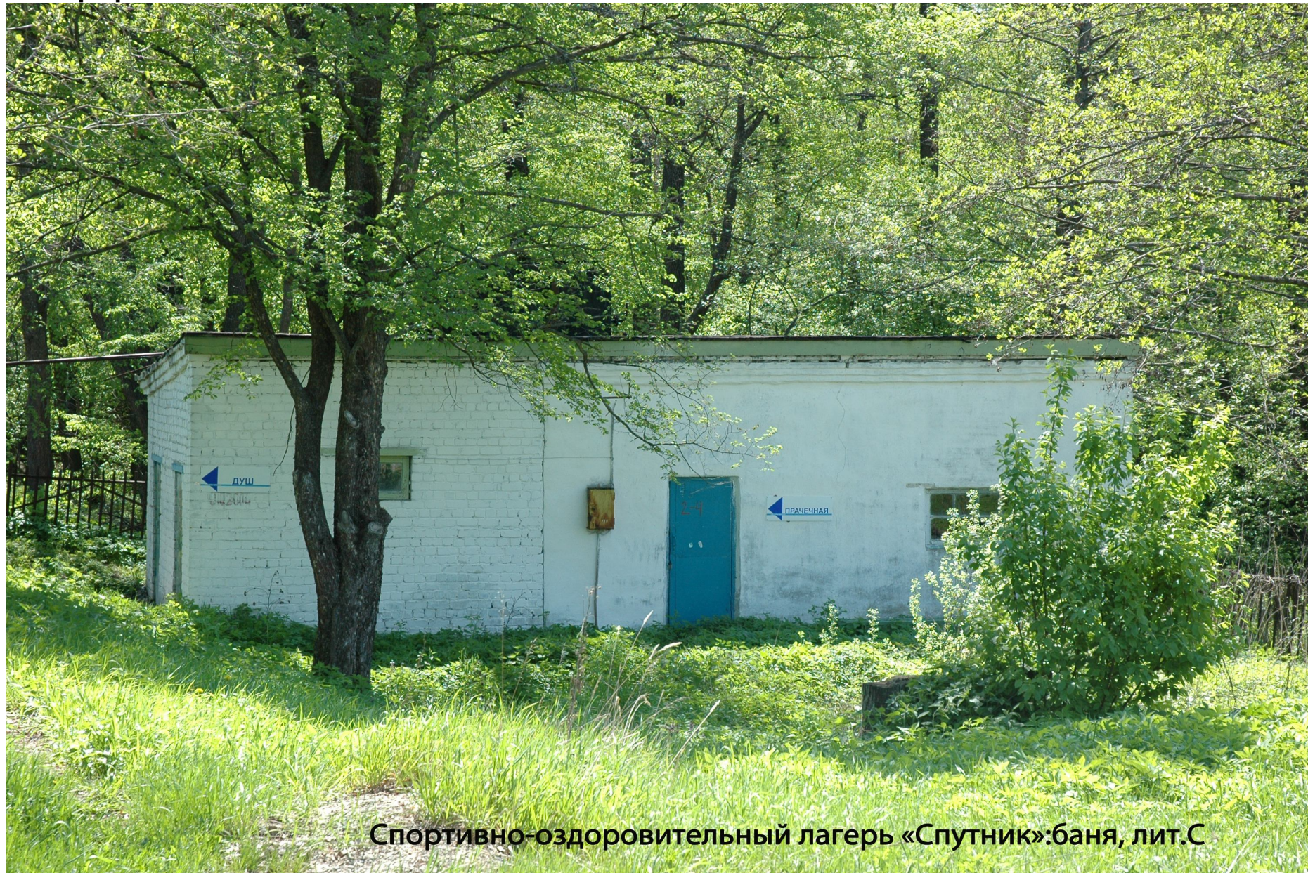
Спортивно-оздоровительный лагерь «Спутник»: баня, лит.С